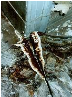
Fruchtkörper des echten Hausschwammes im Eichenparkett

Im gesamten Gebäude konnte an einer Vielzahl von Stellen Fruchtkörper des Echten Hausschwammes ( Serpula lacrimans ) gefunden werden (Abb. 2 bis 4). Deutlich sichtbar ist das rostbraune Mittelfeld mit den Sporen und dem weißlichen Zuwachsrand zu erkennen. In einigen Räumen konnte an den Textil- und Holzverkleidungen watteartiges Luftmyzel des Hausschwammes - aber auch des Kellerschwammes - festgestellt werden. Überall gab es Schimmelpilzbefall ( Aspergillus niger ) und Algenbewuchs. Der Umfang des Pilzbefalls nahm vom Keller zum Dachgeschoss zu. Der Befall durch den Echten Hausschwamm war im Vergleich zu den anderen Geschossen im Keller- und Dachgeschoss geringer. Hier dominierte der Befall durch den Kellerschwamm mit starker Myzelbildung und teilweiser Fruchtkörperbildung.