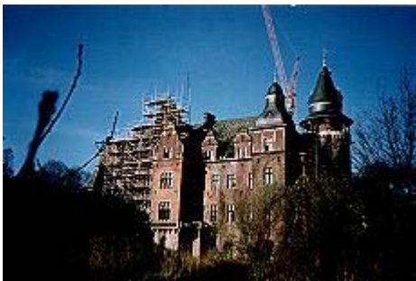
Schloß Krickenbeck während der Sanierung im Frühjahr 1989

Eine wechselnde Geschichte weist Schloß Krickenberg auf. Mehrmals um- und ausgebaut brannte es Anfang dieses Jahrhunderts nieder. Der neue Besitzer ließ im vergangenen Jahr das Kleinod vollständig instandsetzen.