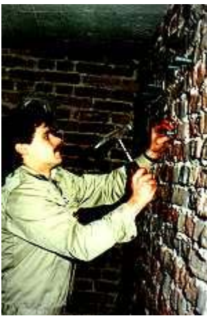
Verschließen der Bohrungen mit Plastikventilen

Der Bauherr forderte, dass nur Schutzmittel verwendet wurden, die das Gütezeichen RAL besitzen und damit automatisch eine amtliche Prüfung auf gesundheitliche Unbedenklichkeit durch das Bundesgesundheitsamt in Berlin durchlaufen haben.