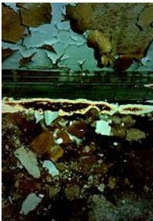
Schimmelpilzbefall an der Wand - Hausschwamm an der Fußleiste

Die Ursache für den starken Pilzbefall konnte mühelos ermittelt werden: Unterlassene Bauunterhaltung, die zu defekten Dachrinnen und Regenrohren sowie Dachundichtigkeiten geführt hatte. Die jahrelange Vernachlässigung der Regenentwässerung hat stellenweise sogar zu Baumbewuchs in den Außenmauern geführt. Darüber hinaus waren vom Voreigentümer erhebliche planerische Fehler gemacht worden. Er hatte in dem Glauben, die Regendichtheit des Daches zu verbessern, das defekte Schieferdach abgetragen und es statt dessen mit einer Unterspannbahn aus gewebearmiertem Kunststoff abgedeckt. Diese war schon nach wenigen Monaten durch starke UV-Strahlung und Windbelastung regelrecht zerbröselnd und zerfetzt. Dadurch konnte das Regenwasser praktisch in alle Geschosse eindringen und den Feuchtegehalt in den organischen Baustoffen (Holz, Textilien, Leim, Papier) so stark erhöhen, dass die Pilze günstige Wachstumsbedingungen vorfanden. Überall dort, wo die Dacheindeckung wenig Schäden aufwies - Bergfried, Turmdächer -, also kein Wasser eingedrungen war, konnte ein wesentlich geringeres Pilzwachstum festgestellt werden.