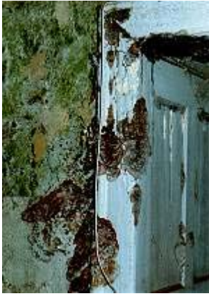
Algenbewuchs und Pilzbefall im Obergeschoss des Schlosses

Im gesamten Gebäude konnte an einer Vielzahl von Stellen Fruchtkörper des Echten Hausschwammes ( Serpula lacrimans ) gefunden werden (Abb. 2 bis 4). Deutlich sichtbar ist das rostbraune Mittelfeld mit den Sporen und dem weißlichen Zuwachsrand zu erkennen. In einigen Räumen konnte an den Textil- und Holzverkleidungen watteartiges Luftmyzel des Hausschwammes - aber auch des Kellerschwammes - festgestellt werden. Überall gab es Schimmelpilzbefall ( Aspergillus niger ) und Algenbewuchs. Der Umfang des Pilzbefalls nahm vom Keller zum Dachgeschoss zu. Der Befall durch den Echten Hausschwamm war im Vergleich zu den anderen Geschossen im Keller- und Dachgeschoss geringer. Hier dominierte der Befall durch den Kellerschwamm mit starker Myzelbildung und teilweiser Fruchtkörperbildung.